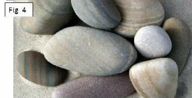
Bilag 2 – bjergarterne